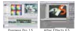
Premiere Pro 1.5

●高速MPEG変換でDVD制作も効率よく ハードウェアMPEG2エンコーダ「StormEncoder」を搭載し、編集した映像をタイムライン上から高速にMPEG変換可能です。